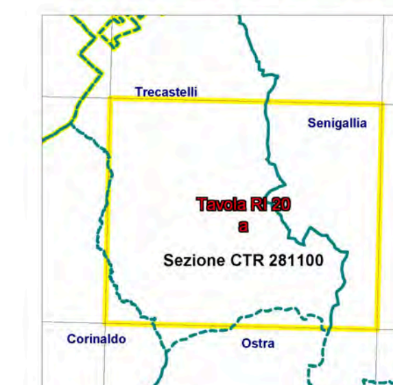
CONFINI AMMINISTRATIVI - INQUADRAMENTO CTR 1:10.000